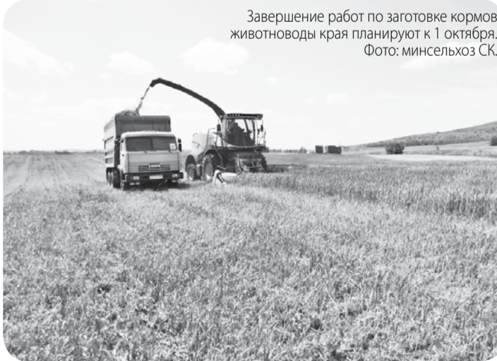
Завершение работ по заготовке кормов животноводы края планируют к 1 октября.

Грубые корма заготавливаются с применением пресс-подборщиков рулонного и тюкового типа – такая технология позволяет повысить качество и сократить потери и затраты труда. Корма складываются на хранение в местах зимовки животных. Завершение работ животноводы планируют к 1 октября.